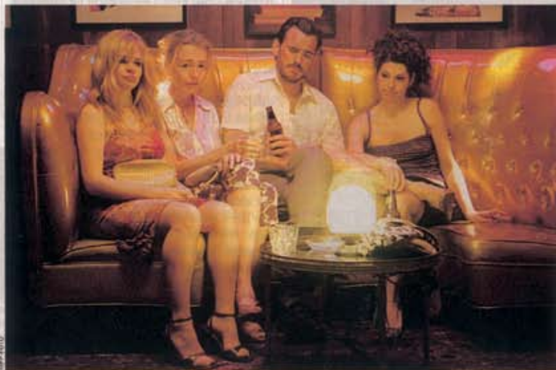
„Factotum“-Star Dillon: Viel zu hübsch fürs jugendliche Alter Ego

Wir sprachen ein wenig über irgendetwas. Bis wir von einem prominenten Todesfall hörten. „Auf das Arschloch“, hob